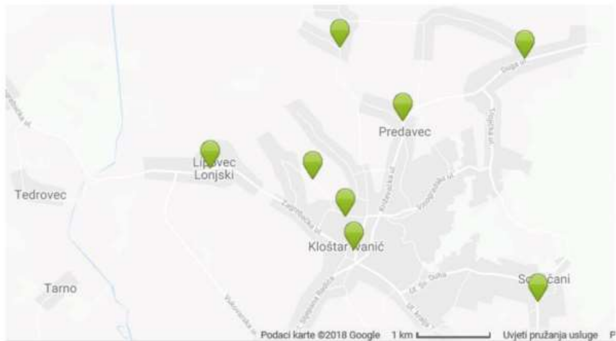
Slika 3: Prikaz lokacija zelenih otoka na području Općine Kloštar Ivanić